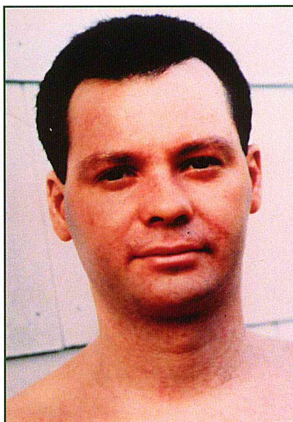
Der sichtbare Behandlungserfolg bei einem Neurodermitispatienten